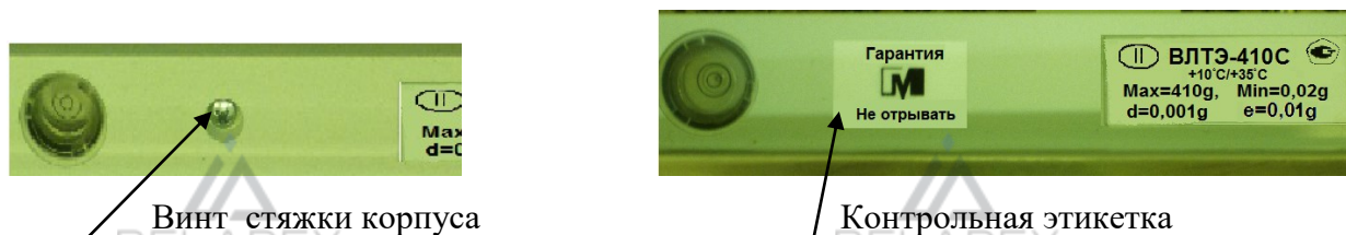
Рисунок 2 - Схема пломбирования от несанкционированного доступа

Для защиты весов от несанкционированной настройки и вмешательства, которые могут привести к искажению результатов измерений, весы пломбируются поверх одного винта стяжки корпуса контрольной этикеткой изготовителя. Схема пломбирования и обозначение места нанесения знака поверки представлены на рисунках 2 и 3, соответственно.