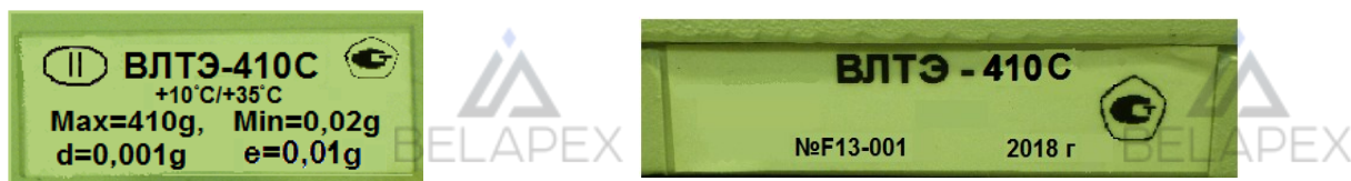
Рисунок 4 – Маркировка весов

Серийный номер и буквенно-цифровое обозначение весов приведены на двух табличках, закрепленных на корпусе весов методом наклейки.